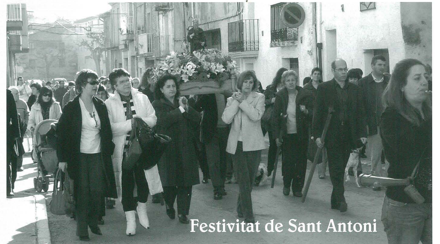
Festivitat de Sant Antoni