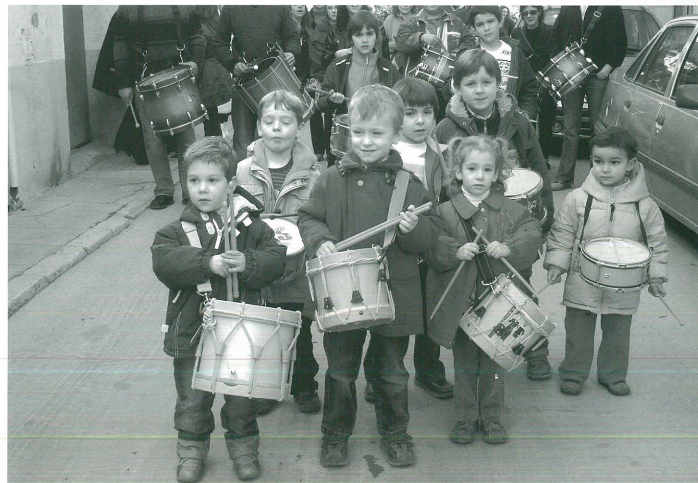
Grup de petits tabaleters que prometen molt