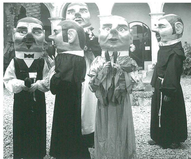
Preparats per a sortir a la desfilada