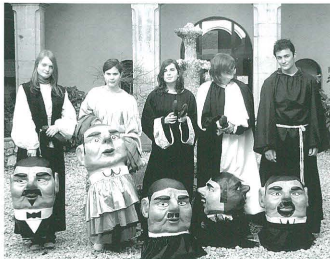
Els joves que hi van col·laborar amb les "botigues al carrer" del pasat mes de febrer

Els "capgrossos" del Centre Cultural van sortir al carrer el dia 10 de febrer per animar la gent a participar en la jornada de "Les botigues al carrer". Els grallers els van acompanyar amb la seva música i tots junts van donar un ambient molt festiu al poble.