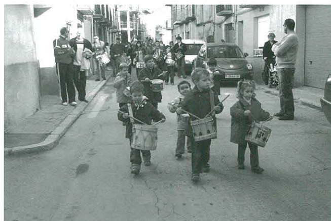
Els petits en plena actuació